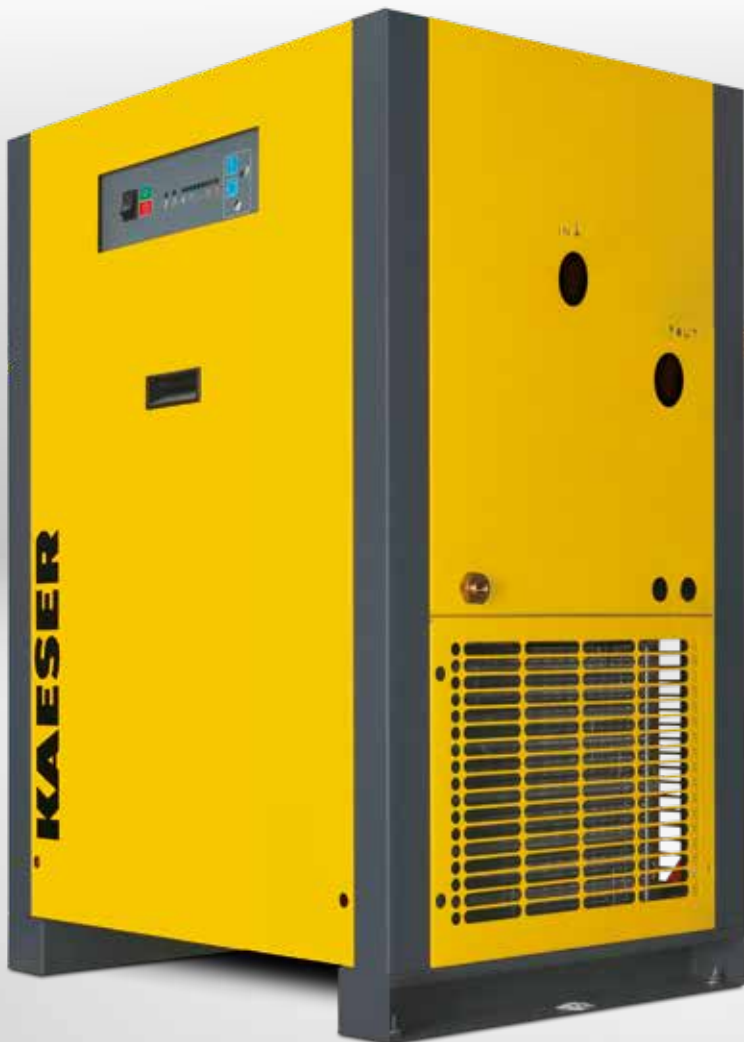
Grundausrüstung THP 40-50